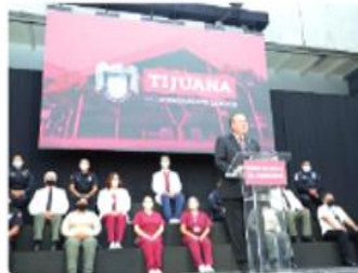
TIJUANA.- El alcalde, Arturo González, señaló que consolidó estrategias para mejorar el bienestar de los ciudadanos, al rendir su Primer Informe de labores, en la casa de los tijuaneños.