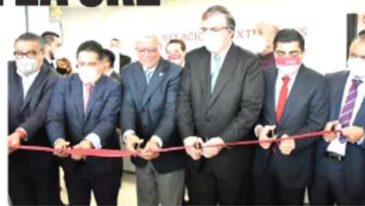
CIUDAD DE MÉXICO.- Jaime Bonilla Valdez, fue invitado a la Ciudad de México, donde acompañó al canciller Marcelo Ebrard Casaubón en la inauguración de un módulo de pasaportes.

CIUDAD DE MÉXICO.- El Gobernador de Baja California, Jaime Bonilla Valdez, ofreció al Secretario de Relaciones Exteriores, Marcelo Ebrard, un espacio para instalar una oficina de pasaportes mexicanos en el Aeropuerto de Tijuana.